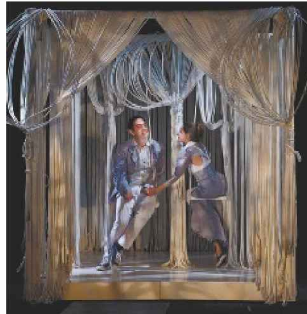
ההצגה "הנזיר השחור" בתיאטרון מלנקי

רמתי אמרה עוד כי הקנס, ששיעורו כ-40% מתקציבו השנתי של התיאטרון, מכביד על מצבו הכלכלי הנואש גם כן, ומ' גדיל את גירעונו עד כדי שיתוק. אחרי שנתיים של חיזור על פתחי משרד התרבות, ניסיונות לערעור על החלטתו, בקשות סיוע ופנייה למשרד בלוויית עורך דין – מאמץ צים שהיו לשווא, לדבריה – אמרה רמתי כי לא יהיה מנוס לעת עתה.